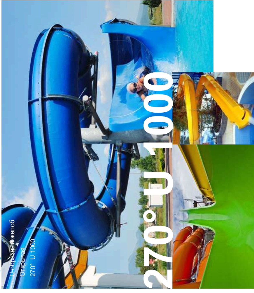
U-образный желоб Открытая 270° U 1000