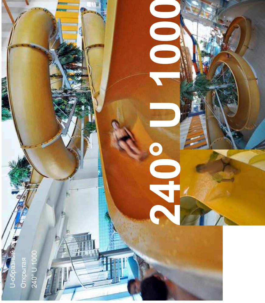
U-образный желоб Открытая 240° U 1000

В этом типе открытой U-образной горки степень открытости меньше, чем в версии 240°. Это дает дополнительное ощущение безопасности пользователей даже при неожиданных и резких маневрах во время спуска. Одновременно она позволяет сохранить очарование спуска в полуоткрытом пространстве.